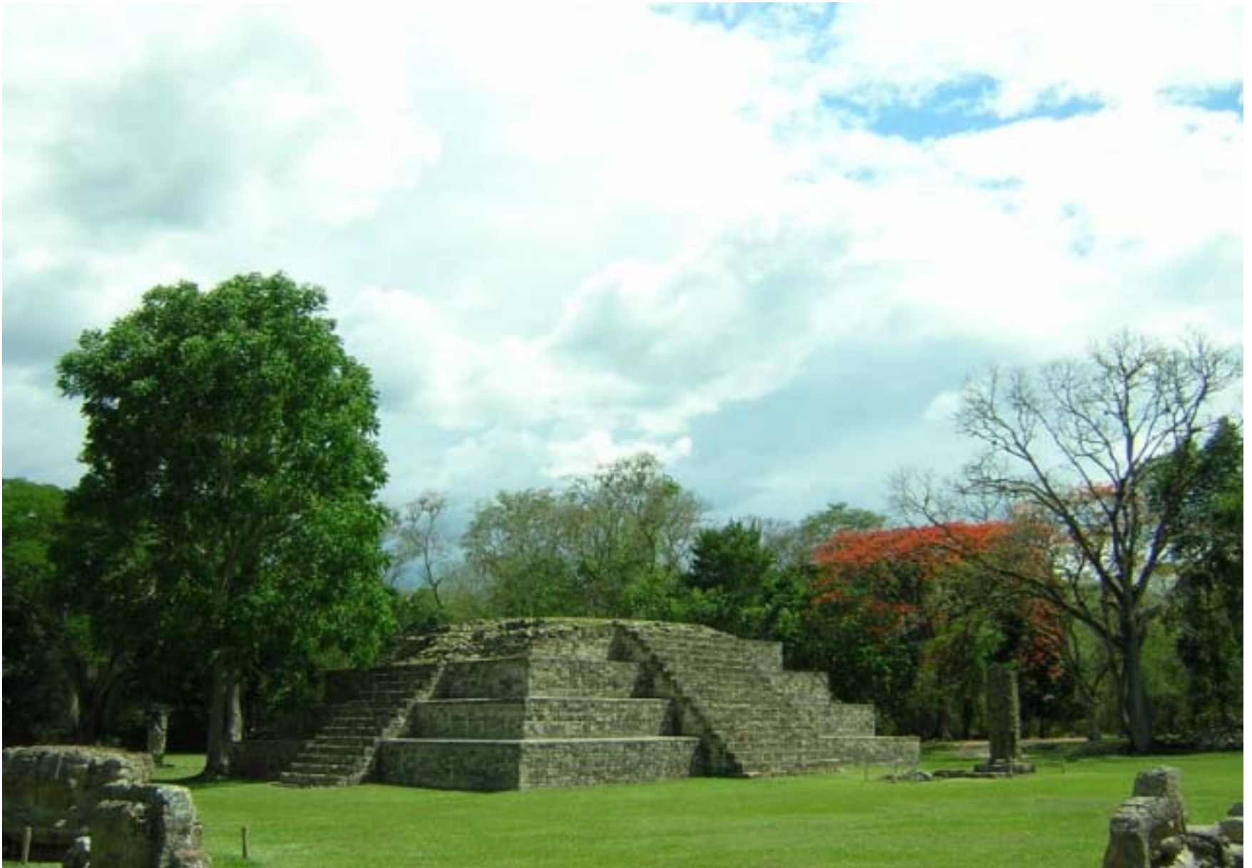
Maya Temple, Ceremonial Plaza, Copán, Honduras